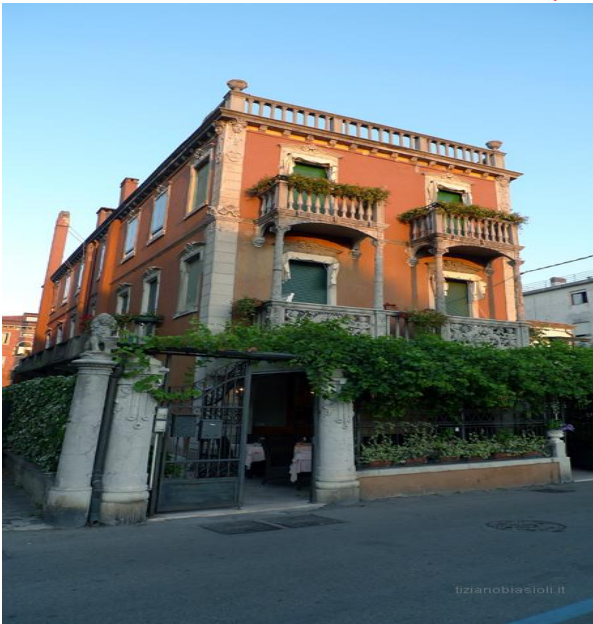
Ristorante da ANDRI

Le cene presso Andri e RistoGolf dovranno essere pagate direttamente dai partecipanti