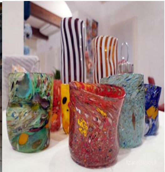
Bicchieri in vendita